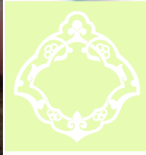
مهد قرآن شهرستان شوش دانیاال